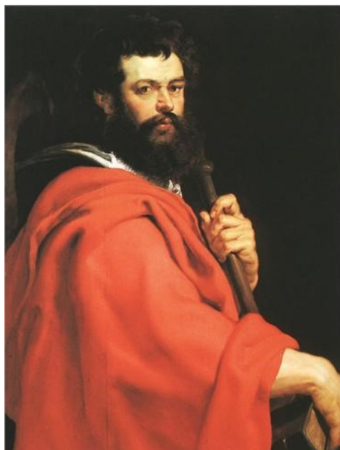
São Tiago Apóstolo, Peter Paul Rubens (1577-1640) |

Tiago também é digno de menção por causa de uma pequena mas significativa jóia de informação.