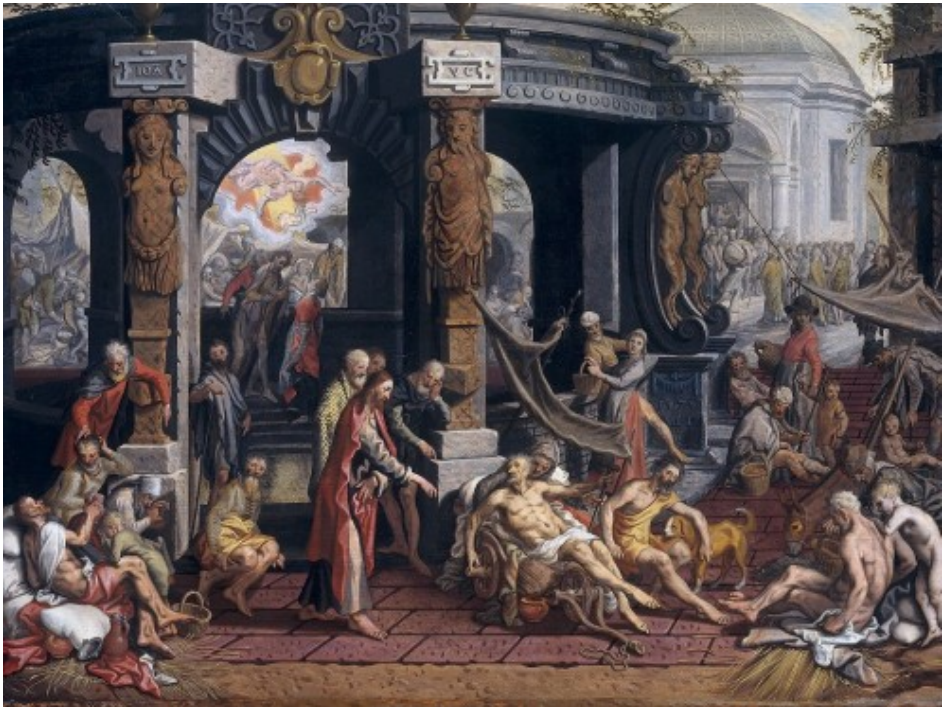
A cura do aleijado de Betesda, Pieter Aertsen (1507-1575) pintou algumas semanas antes de sua morte. |