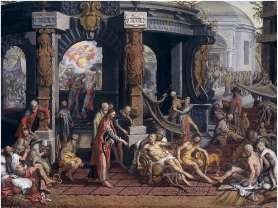
A cura do aleijado de Betesda, Pieter Aertsen (1507-1575) pintou algumas semanas antes de sua morte. |