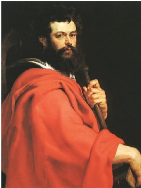
São Tiago Apóstolo, Peter Paul Rubens (1577-1640) |

Tiago também é digno de menção por causa de uma pequena mas significativa jóia de informação.