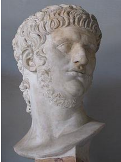
Busto de Nero no Musei Capitolini Roma |